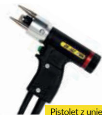
Pistolet z uniesieniem LG2