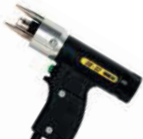
Pistolet kontaktowy C2